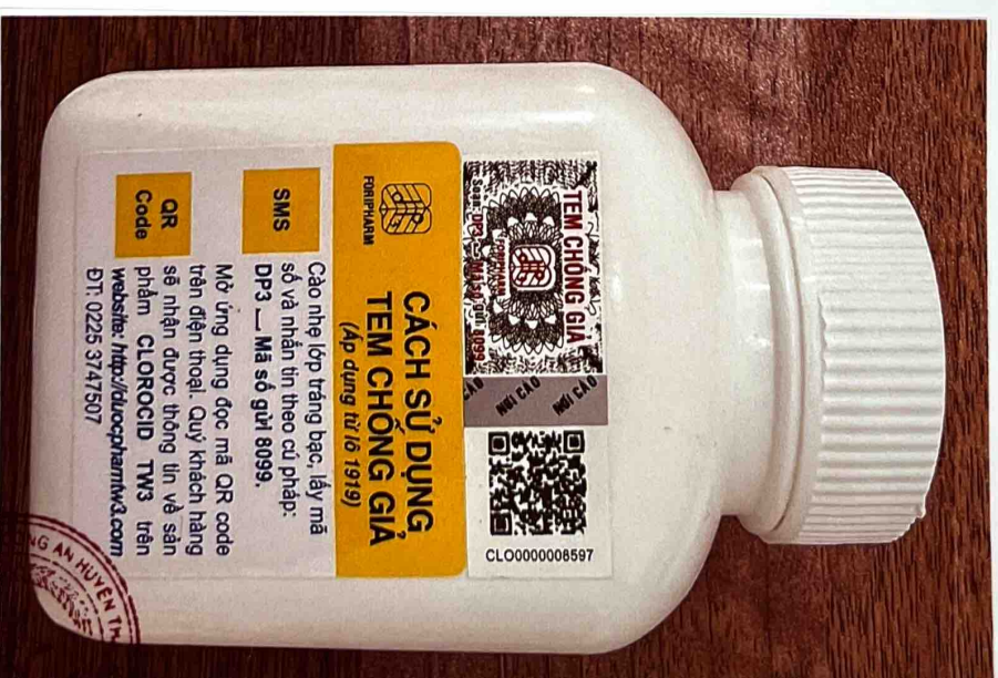
Mặt sau của hộp thuốc

24/02/2023 HÀ NỘI CƠ QUAN QUẢN LÝ THUỐC HÀ NỘI