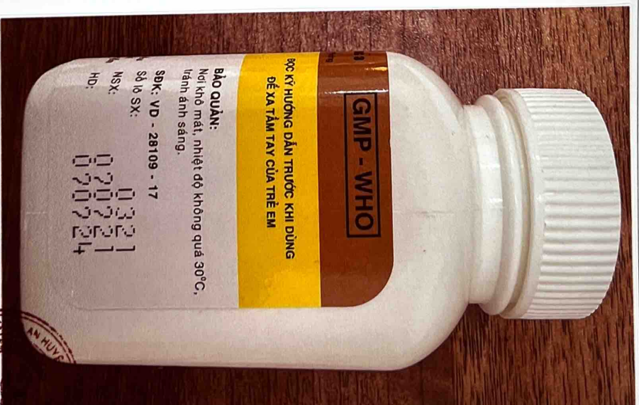
Mặt bên trái của hộp thuốc

33:44 SYT Hanoi và HUYỆN CỘNG HÒA XÃ HỘI CHỦ NGHĨA VIỆT NAM ĐIỀU TRỊ