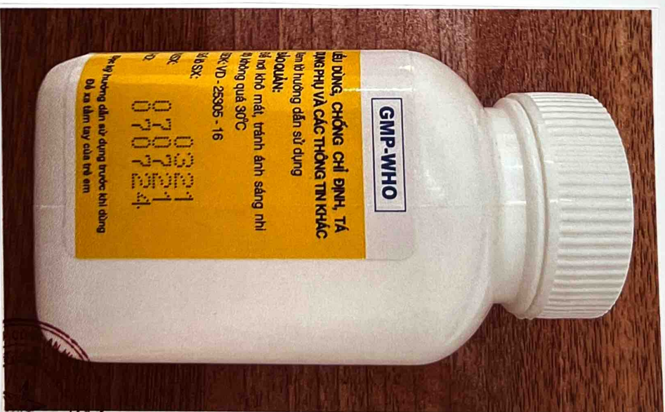
Mặt bên trái của hộp thuốc

synt_hanoi Hanoi Pharmacy Inspection Station Noi: 24/02/2023 17