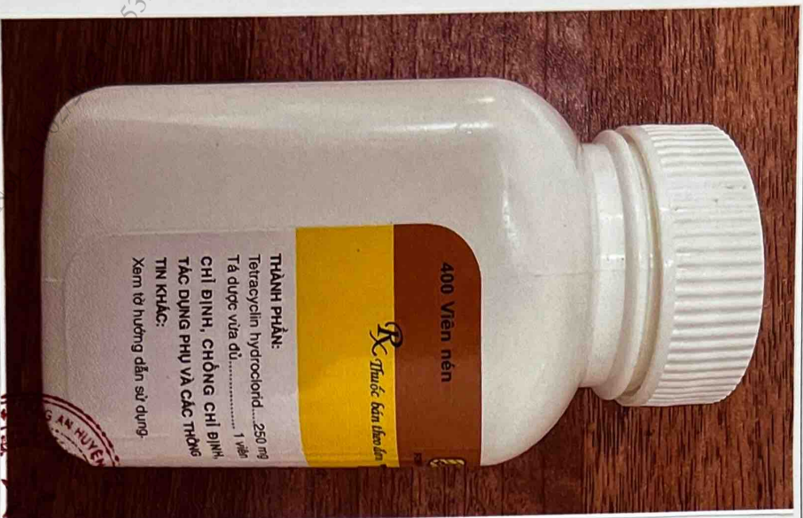
Mặt bên phải của hộp thuốc