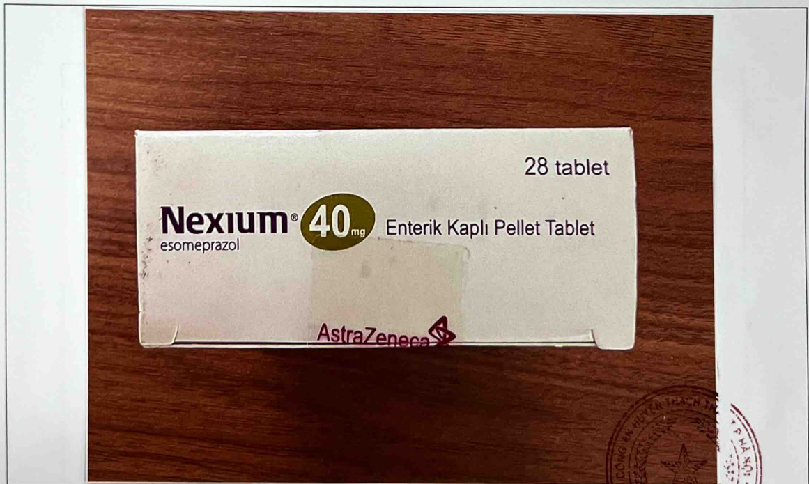
Mặt dưới hộp thuốc