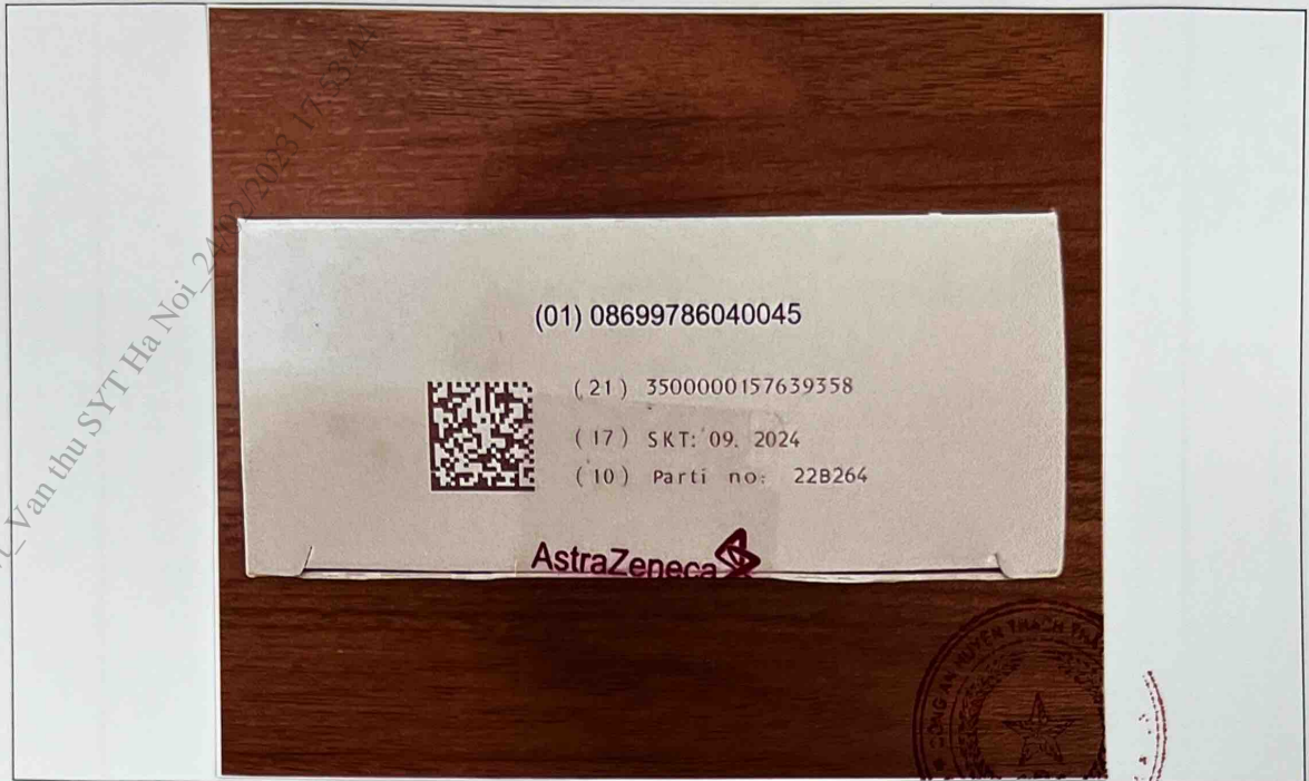
Mặt trên hộp thuốc