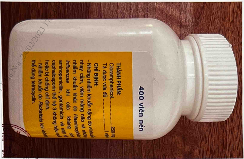
Mặt bên phải của hộp thuốc