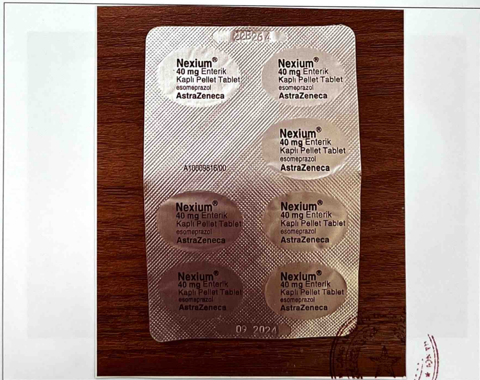
Mặt sau vỉ thuốc