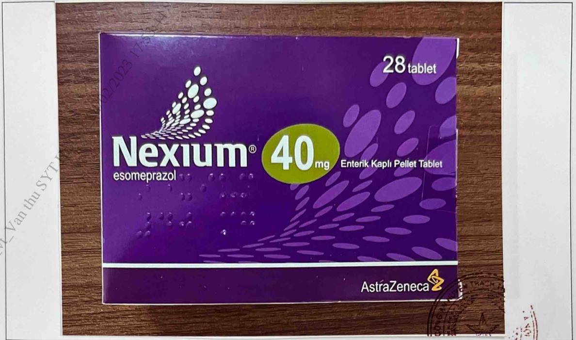
Mặt trước hộp thuốc