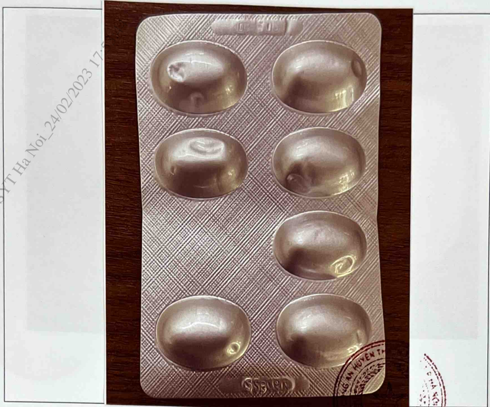
Mặt trước vỉ thuốc

syt_hanoi_vt_Van thu SYT Ha Noi_24/02/2023 17:00